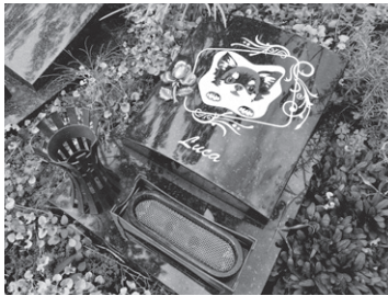
大切なペットと一緒に眠れ、故人の趣向をこらしたデザインができるペット共葬墓所「エトワール」

総面積は、東京ドーム4個がすっぽりと入る22万㎡。約1万7千区画の大規模公園墓地で、墓参り用の